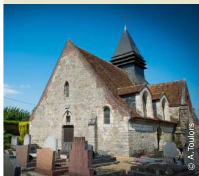
La vieille église de Caumont